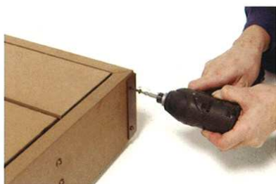
12 コーナー金物取付け