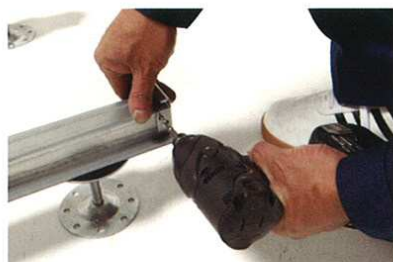
5 端部床板固定金物取付け