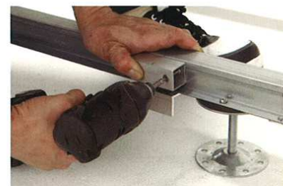
6 幕板固定金物取付け